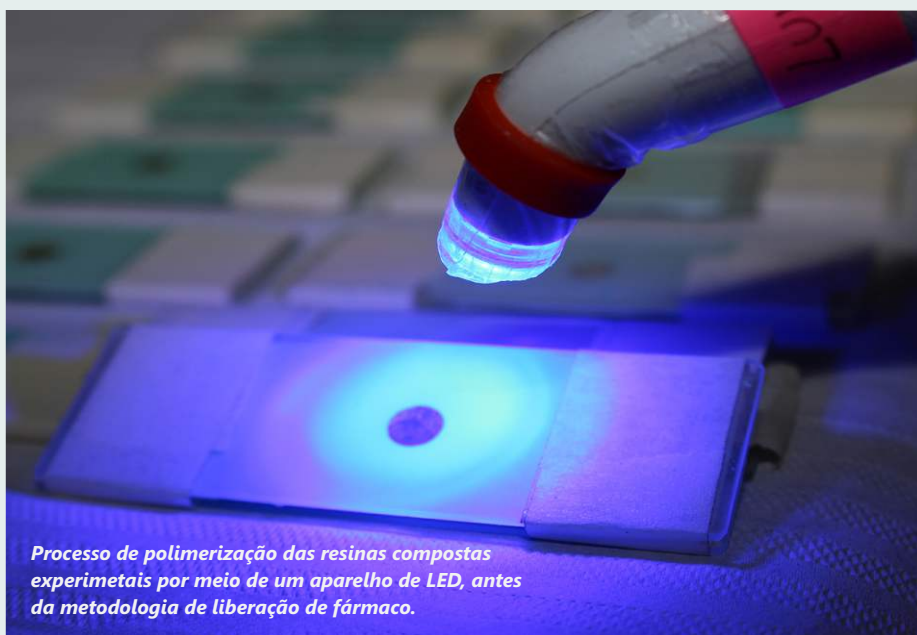
Processo de polimerização das resinas compostas experimentais por meio de um aparelho de LED, antes da metodologia de liberação de fármaco.

Pesquisa em desenvolvimento no Centro de Química e Meio Ambiente (CQMA) tem como finalidade chegar a um produto que seja potencialmente bactericida e proteja contra cáries e infecção dos tecidos. Pioneiro, estudo tem despertado o interesse de Professores da Faculdade de Odontologia da USP.