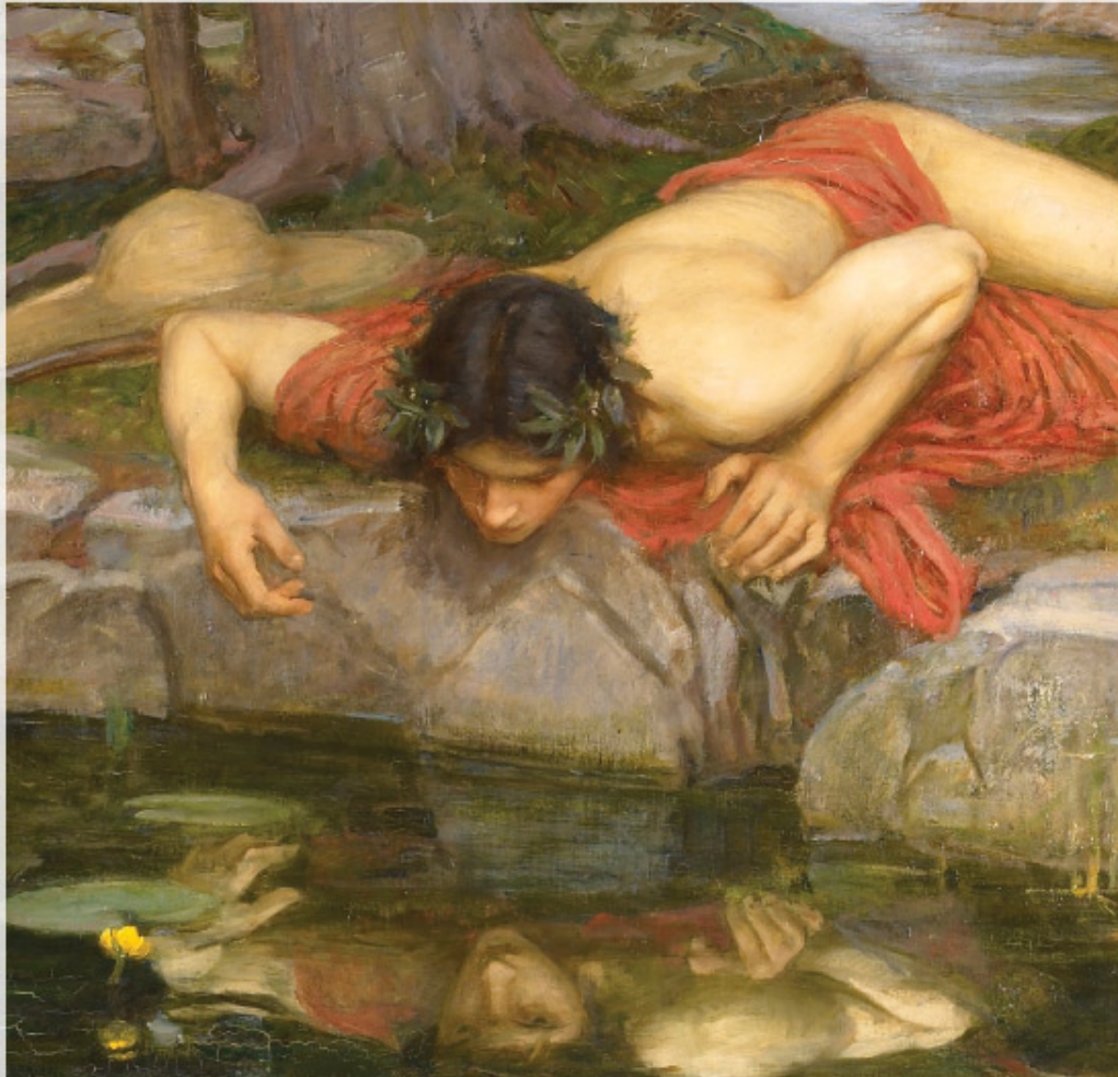
Echo and Narcissus (1903), de John William Waterhouse