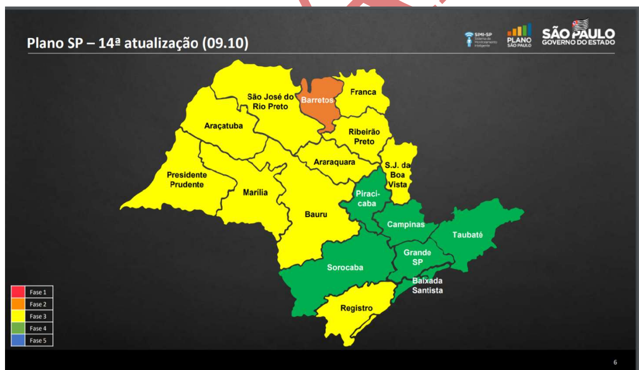
Figura 1 - Atualização do Plano SP: Os 17 Departamentos Regionais de Saúde voltaram a evidenciar diferenças nas condições epidemiológicas, após um mês com todas as regiões na Fase Amarela. Os Campi de São Paulo, Lorena, Piracicaba e Pirassununga estão em regiões que progrediram para a Fase Verde do Plano SP.

Neste sétimo documento, oferecemos à comunidade a versão revisada e atualizada das Tabelas 1 e 2 do Plano USP publicado e divulgado em 18 de agosto. Também tratamos de algumas definições para auxiliar e apoiar os Dirigentes.